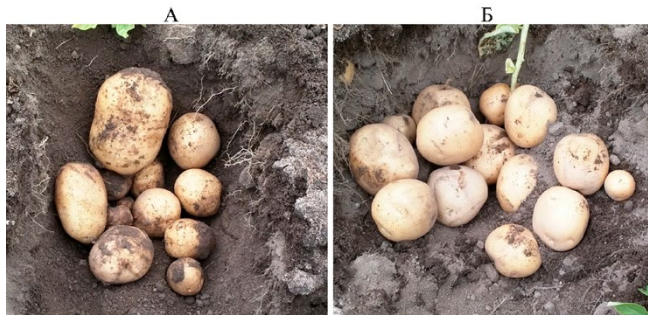
Рис. 3. Клубни картофеля ( Solanum tuberosum L.) под кустом сорта Lady Claire при выращивании на дерново-подзолистой суглинистой почве: А — без обработки этиленом (контроль), Б — с обработкой семенных клубней этиленом (Озерский р-н, Московская обл., 15 августа 2015 года).

района выращивания и применения орошения соответственно на 14,5-42,9; 21,9-29,9 и 4,9-16,3 %, или на 4,5-7,2; 3,5-7,5 и 0,7-4,2 т/га. Была отмечена также более однородная структура урожая (рис. 3).